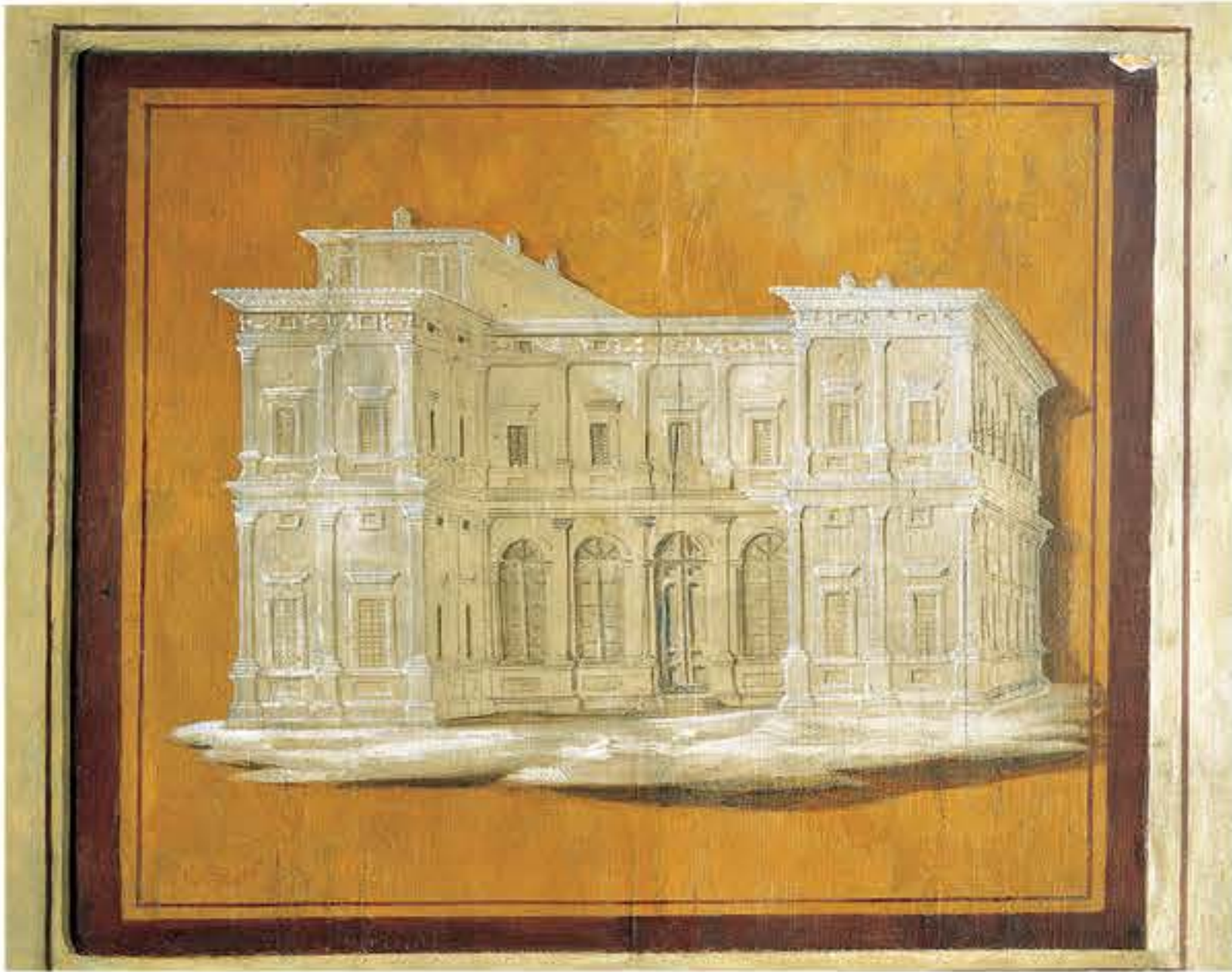
Veduta panoramica di Villa Farnesina su una delle imposte delle finestre Panoramic view of Villa Farnesina on a window shutter